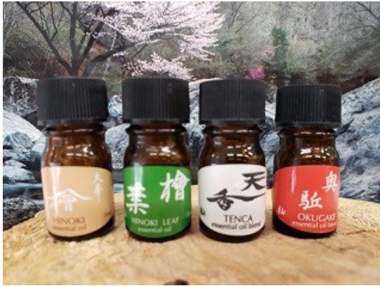
天川の香り Sense of Tenkawa