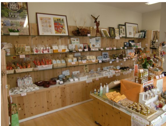
天川村特産品詰め合わせセット