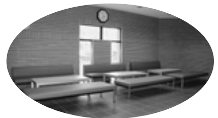
告别ホール内待合スペース