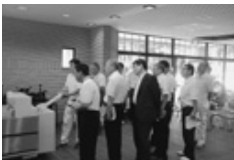
竣工式終了後の施設見学