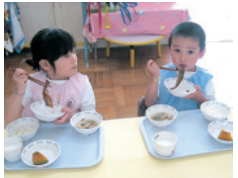
6月9日（木）に幼稚園・小学校・中学校で地元産のアメノウオを使った給食が行われました。