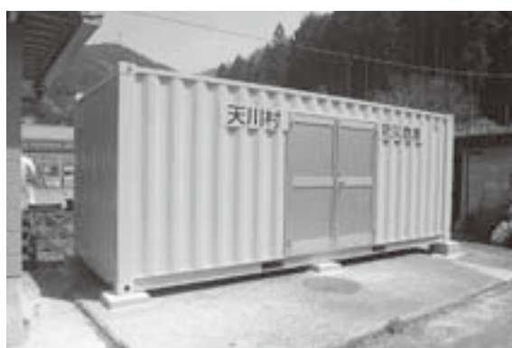
天川村山村開発センター防災倉庫（沢谷）