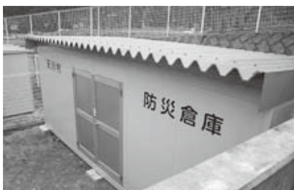
天川小学校防災倉庫（沢谷）