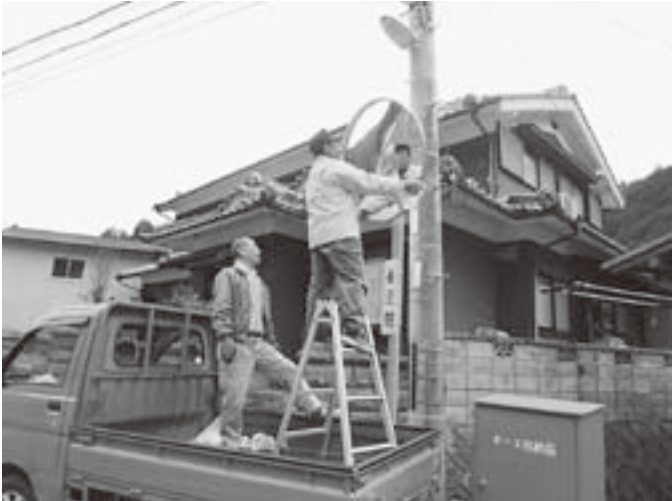
カーブミラー清掃（交通安全協会）

村内主要交差点での街頭指導では、天川村交通安全母の会の役員により作成された啓発物品の「アクリルたわし」を配布させていただきました。また、交通安全協会の役員を中心にカーブミラーの点検や清掃等を実施しました。ご協力いただきました皆様、どうもありがとうございました。引き続き交通安全に努めて下さい。