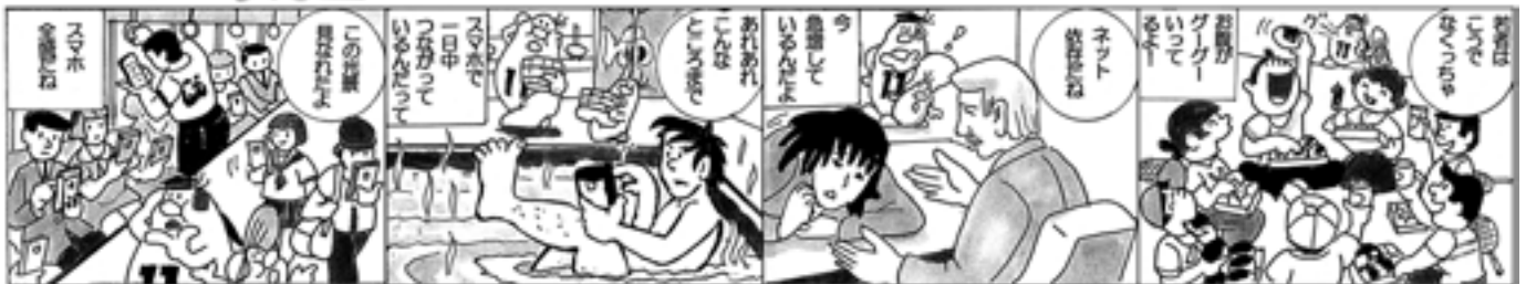
① ② ③ ④