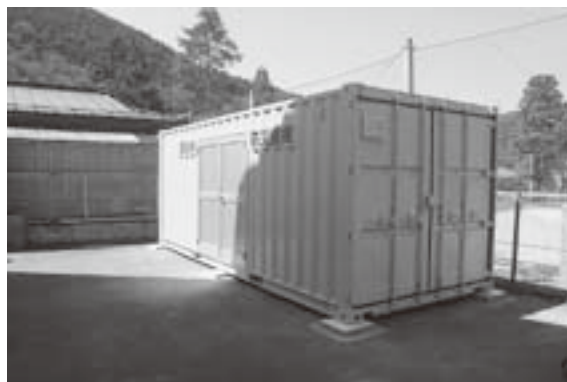
村立体育館防災倉庫（洞川）