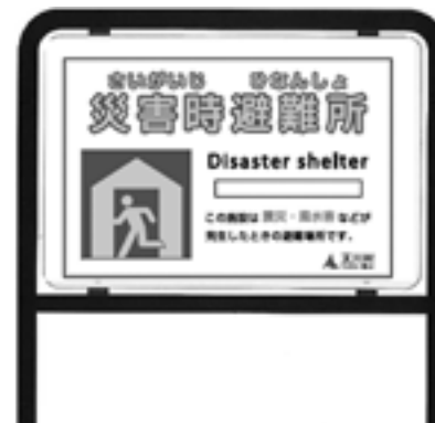
避難標識のイメージ

防犯灯工事とあわせ工事期間中はご迷惑をおかけしますが、ご理解とご協力をお願いします。