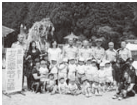
飾り付け記念写真