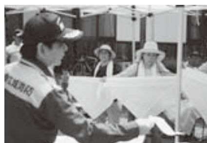
三角巾を使った救急固定術