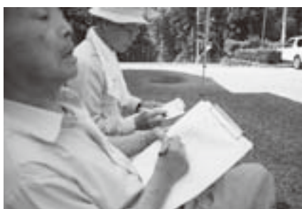
避難者名簿の確認