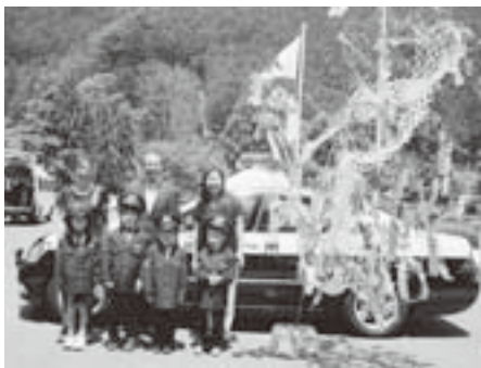
役場へ笹飾りの贈呈