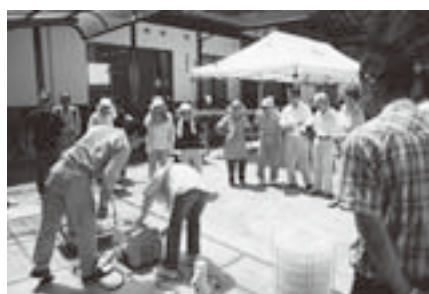
ガス式発電機の訓練