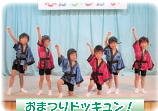
おまつりドッキン！