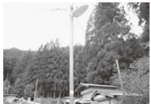
避難経路の防犯灯（九尾地内）