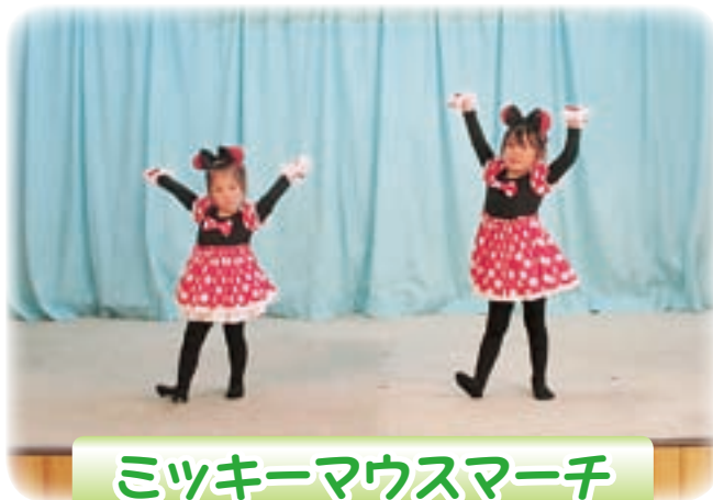
ミッキーマウスマーチ