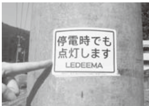
蓄電池式誘導灯の表示

蓄電池式防犯灯には、設置している電柱や鉄柱などに下記の表示をしていますので、みなさまの地区でも普段から確認しておくようにしましょう。