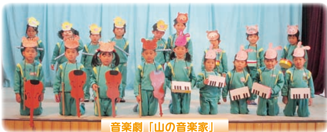
音楽劇「山の音楽家」