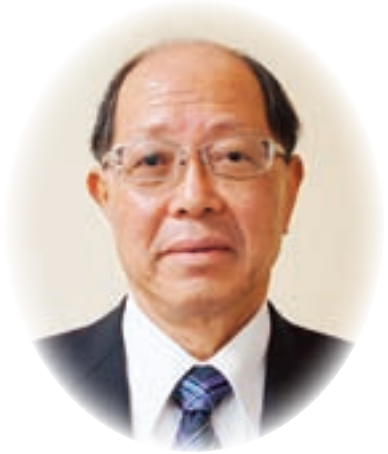
天川村長 森本靖順