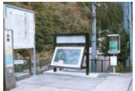
天川薬湯センター