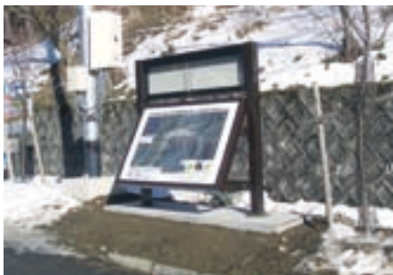
洞川温泉センター

村民の皆様はもとより観光客の方々にも、避難所や土砂災害危険箇所を把握してもらい安心・安全の村づくりを目指します。