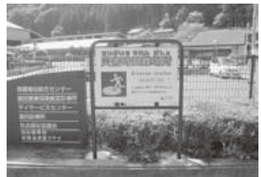
ほほえみポート天川