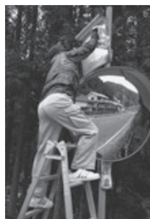
カーブミラーの点検・清掃活動