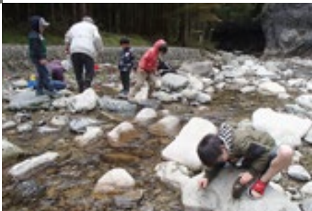
きれいな川探検！ 水生昆虫の観察会