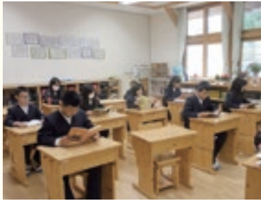
朝の読書(火・金曜日)