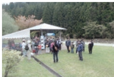
野草の観察と 山菜の試食会