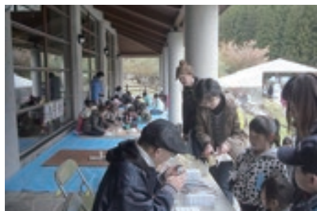
いろんな形で ストーンペイント教室