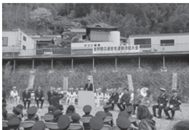
「吉野路交通安全運動」決起大会