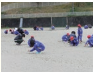
運動場草引き(木曜日不定期)

子どもたちの視力が低下傾向にあります。ゲーム機・パソコンからの目の疲れを少しでも和らげたいと考えています。