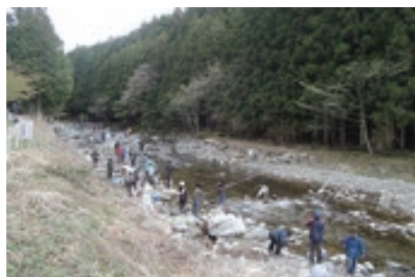
親子アメノウオ 釣り大会