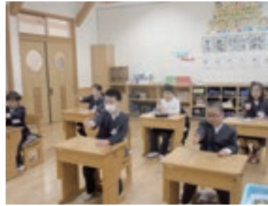
目の体操(火・水・金曜日)

子どもたちの視力が低下傾向にあります。ゲーム機・パソコンからの目の疲れを少しでも和らげたいと考えています。