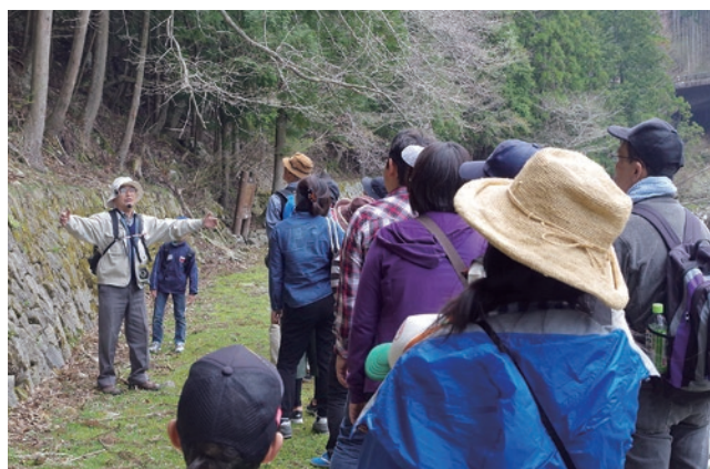
野草の観察と山菜の試食会