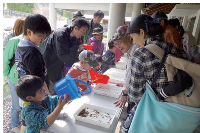
きれいな川探検！水生昆虫の観察会