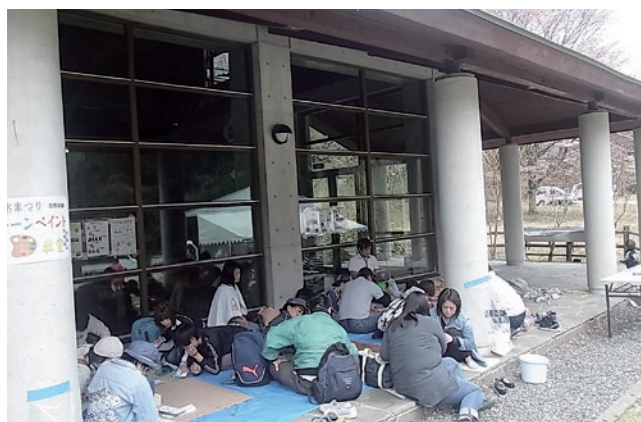
いろいろな形でストーンペイント教室