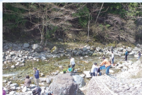
親子アメノウオ釣り大会

身近なものも、やり方・見方を変えると、けっこう楽しいですよ！ 来年もみなさんの参加をお待ちしています！