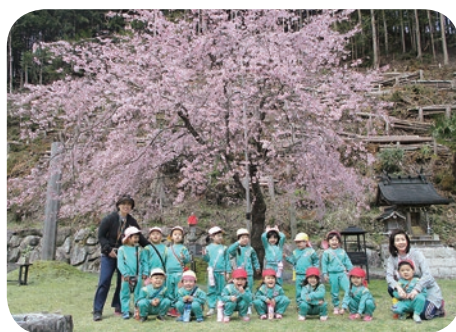
散歩でお花見しました。 「わー。桜が満開だよー」