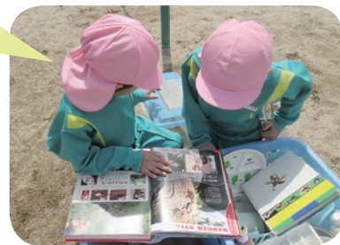
この虫なんていう 名前なんやろう？