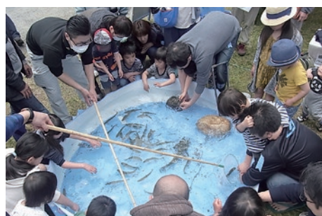
アメノウオのつかみ取り