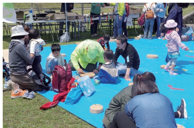
木の枝を使ったクラフト教室