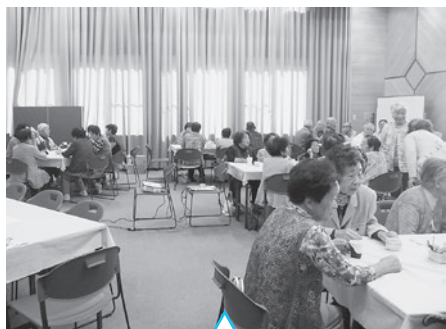
サロンには多くの人が参加されました