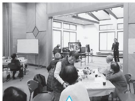
サロンの最後はカラオケ大会！