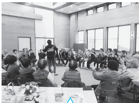
みんなで脳トレ中