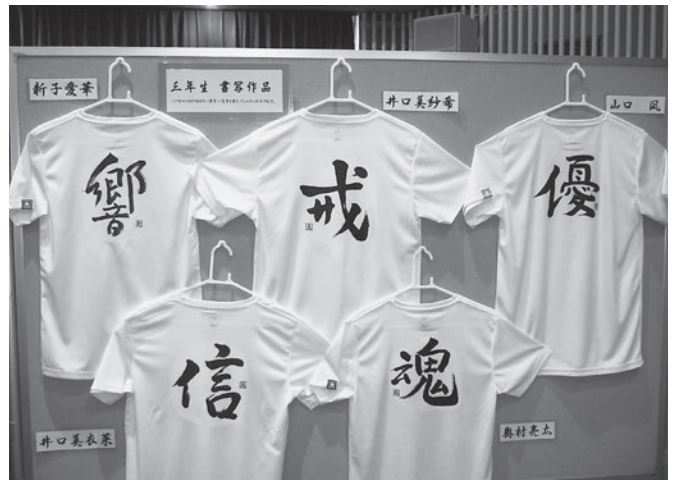
素晴らしい書写作品