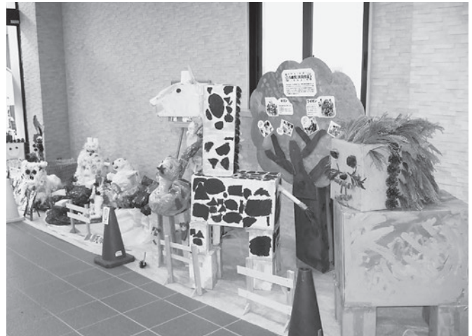
動物園に行ったよ！

昨年は庁舎耐震工事の為、実施できなかった【天川村子ども作品展】ですが、今年は無事、天川村もみじまつり開催日の11月4日・5日に同日開催することができました。