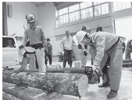
講師によるチェーンソーの構造やメンテナンスの説明、実際に丸太を切りました。