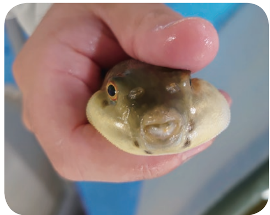
持ち上げられて威嚇のために少し膨らんでいます。怒ってるんですがかわいいですね。

温度はどんな生き物にも関わる大事なことなので、自宅で飼われているペットたちが食いつきや元気がなければ温度に注目してあげてください。