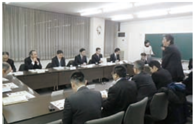
役場において意見交換会