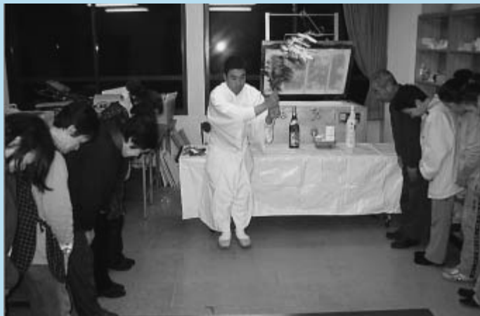
平成19年1月9日 初窯火入れ式

平成19年1月20日から約1ヶ月間、第2回陶芸クラブ(天陶虫)作品展示会を『ほほえみポート天川』で開催しています。