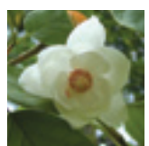
村の花 オオヤマレンゲ