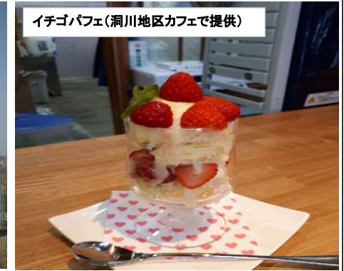
イチゴパフェ(洞川地区カフェで提供)