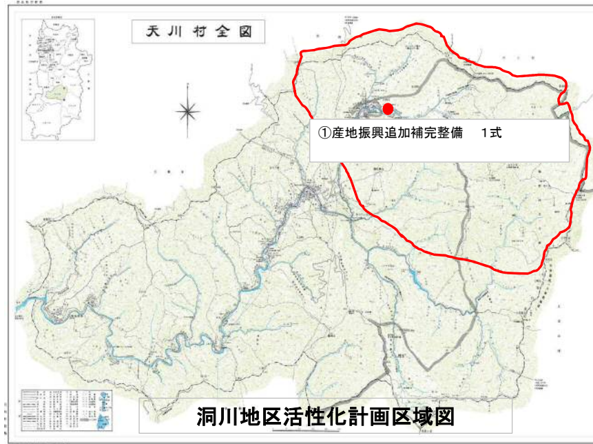
洞川地区活性化計画区域図