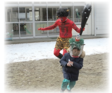
みんなで風邪引き鬼や意地悪鬼を追い出しました。