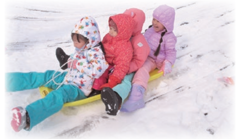
2歳児さんも一緒に楽しみました。