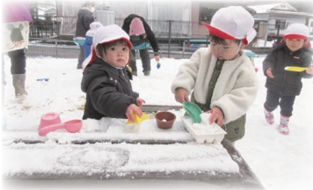
ごちそう作り、かまくら、そり遊び、雪遊びって楽しいね！

4月からは、幼保敷地内一体化がスタートします。0歳児から5歳児までの保育・教育がスムーズに展開できるよう職員一丸となり取り組んでいきたいと思ひます。