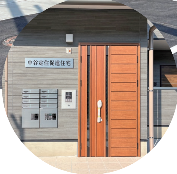
中谷定住促進住宅 (関連ページ P2)