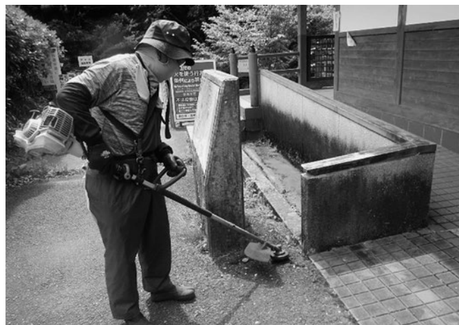
観光施設の草刈り