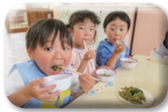
山菜摘みを体験し、いたんぼ料理を作りました。天川ならではの自然の恵みを美味しくいただきました。

園では、見て、触って、味わう食育体験ができる栽培活動に取り組んでいます。野菜や果物を自分達の手で育てることで、食べ物ができるまでの過程を実感し、好き嫌いの軽減や「いただきます」「ごちそうさま」の意味への気付きにつながり、食への関心と感謝する心を育てています。今年度は、かぼちゃ・玉ねぎ・じゃがいも・人参・トマト・きゅうり・さつまいも・スティックブロッコリー・ほうれん草・なす・二十日大根・ピーマン・いちご・スイカなどを栽培しています。みんなで収穫を楽しみにしながら心を込めて育てていきたいと思ひます。